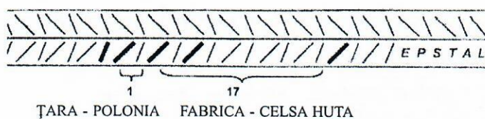
Fig. 1 Marcarea barelor din oțel beton cu profil periodic